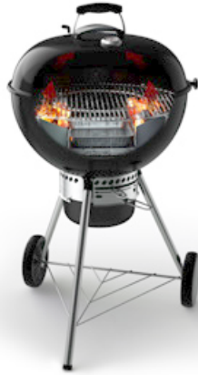
2 HOLZKOHLEGRILL, INDIREKTE GRILLMETHODE

Für Gerichte, die weniger als 20 Minuten Garzeit benötigen. Dazu die Briketts gleichmäßig auf dem gesamten Holzkohlerost verteilen oder in die Holzkohlekörbe füllen und diese in der Mitte des Kohlerosts platzieren. Das Grillgut direkt über den Briketts auf dem Grillrost grillen.