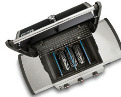
1 DIREKTE GRILLMETHODE