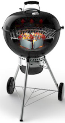
1 HOLZKOHLEGRILL, DIREKTE GRILLMETHODE