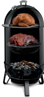
3 WEBER SMOKEY MOUNTAIN COOKER: RÄUCHERN

Für Gerichte, die eine längere Garzeit als 20 Minuten haben. Dazu die Briketts auf beiden Seiten des Holzkohlerosts verteilen oder in die Holzkohlekörbe füllen und auf jeder Seite des Kohlerosts positionieren. Eine Alu-Tropfschale zwischen den Briketts platzieren und den Deckel des Grills schließen. Die Zutaten in der Mitte des Grillrosts oberhalb der Tropfschale grillen. Den Deckel so positionieren, dass sich die Lüftungsöffnung zwischen den Briketts befindet.