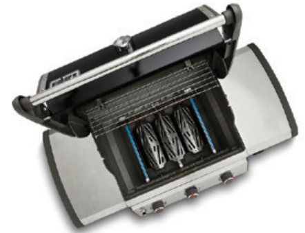
2 INDIREKTE GRILLMETHODE

Entzünde alle Brenner. Schließe den Deckel. Bürste den Grillrost vorsichtig ab, wenn der Grill die richtige Temperatur erreicht hat. Fette den Grillrost vor dem Grillen ein – z. B. mit dem Antihaft-Spray von Weber®. Lege das Grillgut direkt über den Brennern auf den Grillrost. Schließe den Deckel.