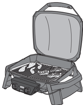
2 50/50 GRILLMETHODE

Regler auf „high“ drehen und Grill auf 260 °C vorheizen. Rost reinigen. Regler auf gewünschte Temperatur einstellen und Speise direkt auf den Rost legen. Für größere Fleischstücke empfiehlt sich die Verwendung eines iGrill Kerntemperaturfühlers zur Überwachung der Kerntemperatur.