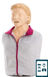
Little Anne QCPR