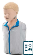
Little Junior QCPR