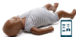
Little Baby QCPR

+ 6 szt. dodatkowych płuc + 2 baterie AA