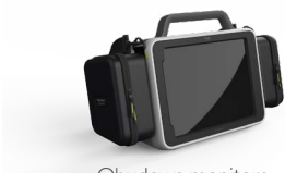
Obudowa monitora z wbudowanym iPad Pro

Monitor posiada wszystko, aby rozpocząć szkolenie, w tym: