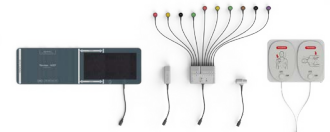
Zestaw symulowanych przewodów: mankiet NIBP, SpO 2 , etCO 2 , elektrody treningowe AED, 4+6-odprowadzeniowe EKG (ERC lub AHA)