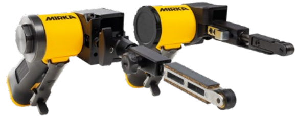
Mirka® PBS 13NV 13x457 mm ja Mirka® PBS 10NV 10x330 mm