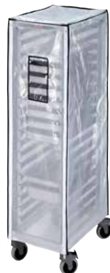
GBCTUGNPR11 Opcjonalna pokrowiec winylowy o dużej wytrzymałości do pełnego wózka GN 1/1.

Wszystkie wózki pochodzą z gotowymi ramkami oraz słupki z kółkami.