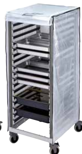
GBCTUGNPR21 Opcjonalna pokrowiec winylowy o dużej wytrzymałości do pełnego wózka GN 2/1.