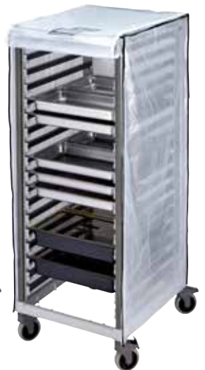
GBCTUGNPR21 Optional Heavy Duty Vinyl Cover for GN 2/1 Full Size Trolley.