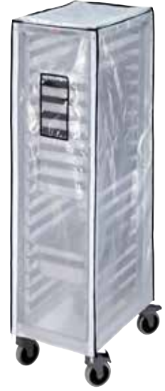
GBCTUGNPR11 Optional Heavy Duty Vinyl Cover for GN 1/1 Full Size Trolley.

모든 Trolley 는 바퀴와 하단 프레임 빼기가 사전 조립되고 기타 부분은 분리된 상태로 (KD:넉다운) 배송됩니다.