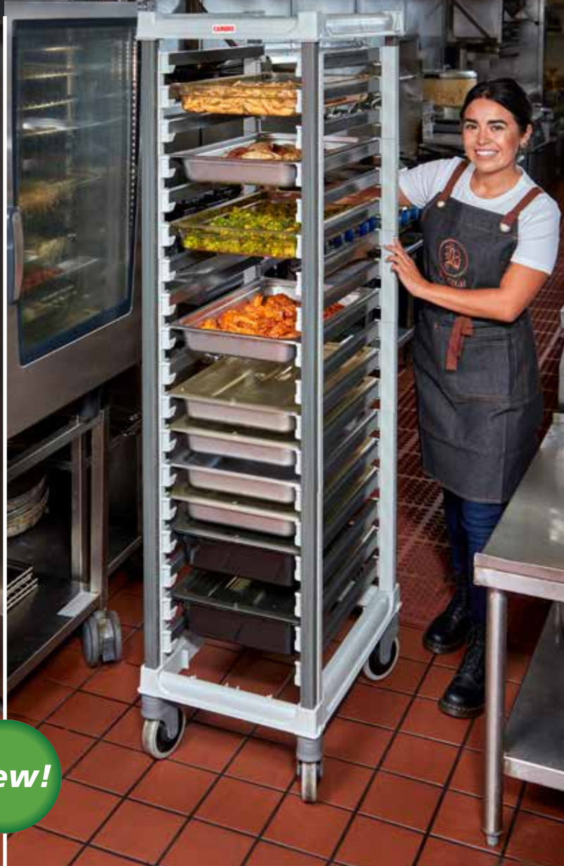
Full storlek GN 1/1 Kantinvagn UGNPR11F18