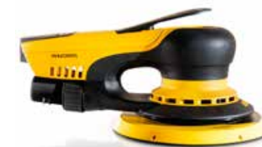
Mirka® DEROS 650 CV Ø 150 mm, orbita 5 mm