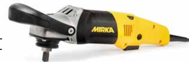
Mirka® PS 1437 Lucidatrice, Ø 150 mm