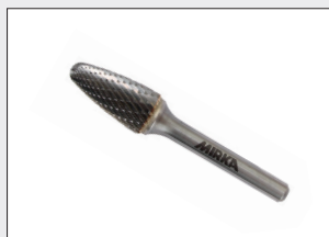
Utensili da taglio, da sbavo e altri utensili compatibili con il mandrino da 6 mm