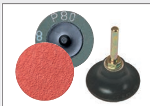
Altri dischi ad attacco rapido 50 mm / Grane 36 - 120