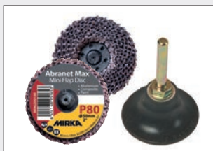
Dischi lamellari Abranet Max 50 mm / Grane 40 - 120