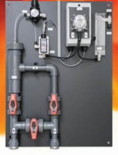
Numune Ön Koşullandırma Panosu