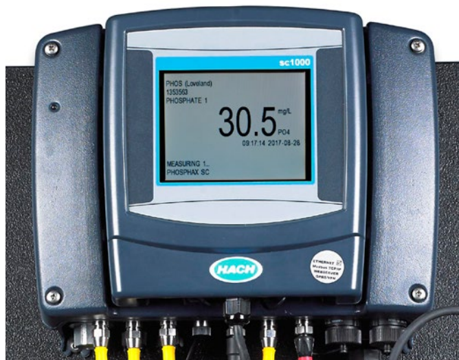
Figura 4: Ejemplo de datos en tiempo real de Phosphax