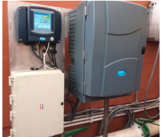
Figura 2: Ejemplo del sistema RTC-P