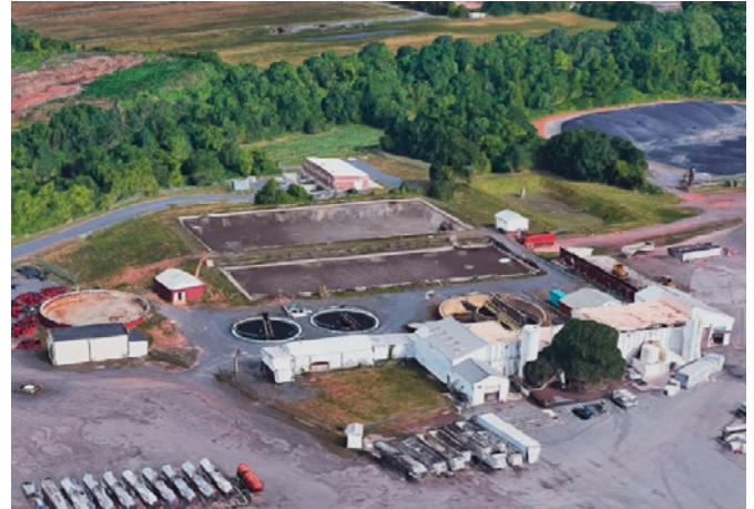
Figura 1: La planta de tratamiento de aguas residuales de JBS vierte directamente en el río Skippack Creek, que desemboca en el río Delaware.

Con Prognosis, un sistema de diagnóstico predictivo incluido en el analizador Phosphax, el cliente también recibe notificación de próximos problemas que pueden producirse en el instrumento y que se muestran en el controlador SC1000, de modo que puedan llevar a cabo un mantenimiento proactivo. De este modo, los operadores de la planta de tratamiento de aguas residuales saben con seguridad si los cambios en las mediciones se producen debido a alteraciones en los instrumentos o en la propia agua.