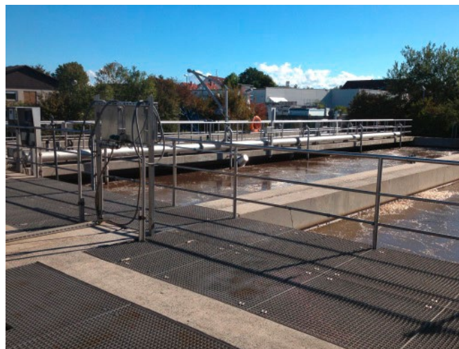
Diseño de dos líneas en la planta de aguas residuales

La planta de tratamiento de aguas residuales de Hessen se restauró por última vez en 1998 y su función es mantener el buen estado de la cuenca del río Nidder. La planta procesa las aguas residuales de dos comunidades conexas. Diseñada con una capacidad de tratamiento para 23 000 habitantes equivalentes, en la planta se trata un volumen de depuración de más de 2 300 000 \text{m}^3 al año. Las aguas residuales se transportan al sistema biológico de dos líneas a través de un sistema de limpieza mecánica. El agua se limpia mediante métodos biológicos en los tanques anóxicos (mayor eliminación biológica de fósforo inicial) y en los dos tanques de aireación de la parte posterior, con un tanque de preaireación, utilizando aireación alterna o intermitente. El agua tratada pasa a dos tanques de decantación final antes de verterse en el río Nidder. La planta de tratamiento de aguas residuales necesitaba una solución que permitiera optimizar la desnitrificación ( \text{NO}_3\text{-N} demasiado alto en la salida) y reducir el fósforo. Se llevó a cabo un intento anterior a la optimización en 2011 que no funcionó correctamente y la iniciativa se descartó en 2013.