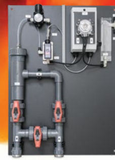
Ploča za pretkondicioniranje uzorka