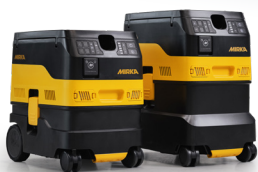
Mirka® DEXOS 1217/1230 M