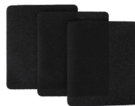
Almohadillas de la Guía para Cantos