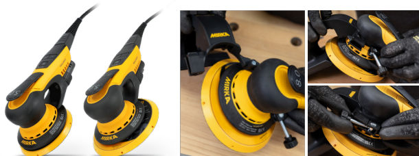
Mirka® DEROS II 550 y 650 (125 y 150 mm)