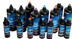
Pastas de Polimento Polarshine

A Mirka oferece uma ampla gama de boinas de lã e espuma, além das pastas de polimento Polarshine® com base de água e gradação de grossas a finas. Tanto no corte como no acabamento, conseguirás um resultado limpo e de alto brilho em pintura, verniz ou gelcoat.