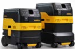
Mirka® DEXOS 1217/1230 M