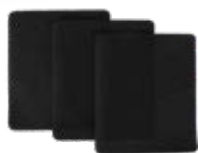
Filzpad für Winkelanschlag