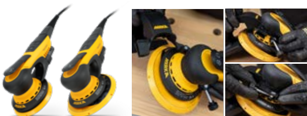
Mirka® DEROS II 550 und 650 (125 und 150 mm)