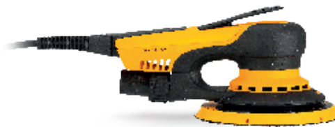
Mirka® DEROS II 650CV Ø150 mm, órbita 5 mm