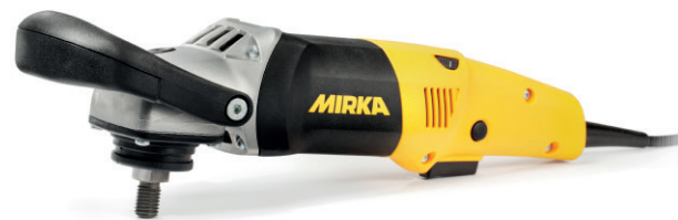
Mirka® PS1437 Pulidora, 150 mm