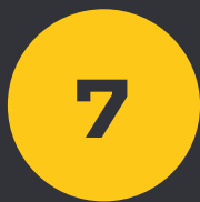
Pays d'approvisionnement de rang 1