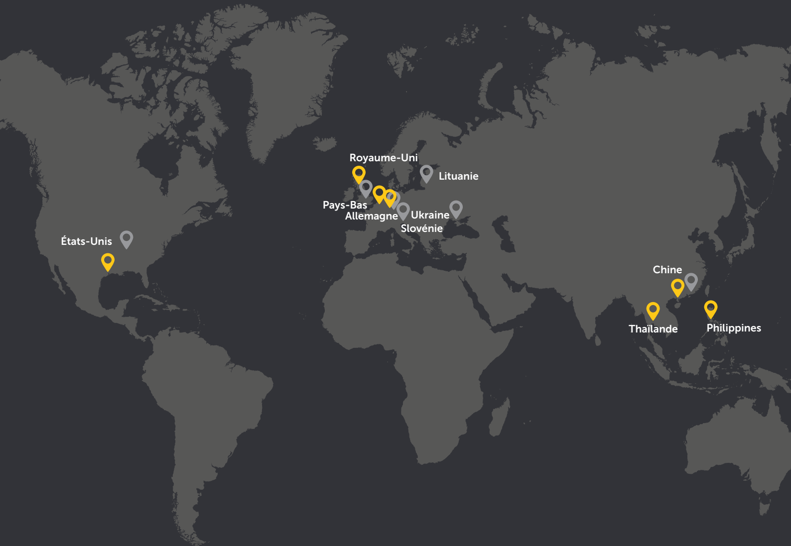
Schéma des fournisseurs et opérations