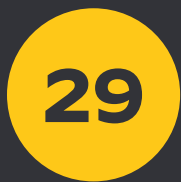
Fournisseurs de rang 1