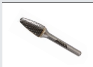
Kovametalliviilat ja muut 6 mm:n holkkiin menevät työkalut

Suosittellemme kuulosuojaimien sekä suojakäsineiden ja -lasien käyttöä hiottaessa.