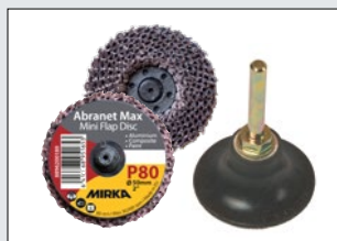
Abranet® Max lamellilaikat 50 mm / karkeudet 40-120