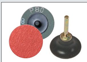
Pikakiekot 50 mm / karkeudet 36-120